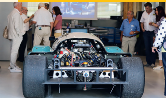
Vor der Generalversammlung besichtigten die ACS Mitglieder die Horag Hotz Racing AG und erhielten einen Einblick in die über 50-jährige Firmengeschichte.