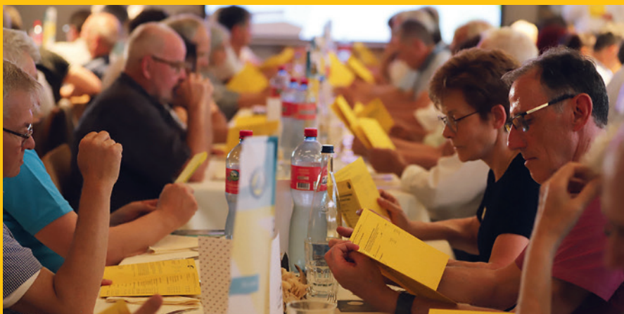
Antwärtlich der 112. Generalversammlung war der Löwensaal in Sulgen mit 160 Clubmitgliedern bis auf den letzten Platz besetzt.