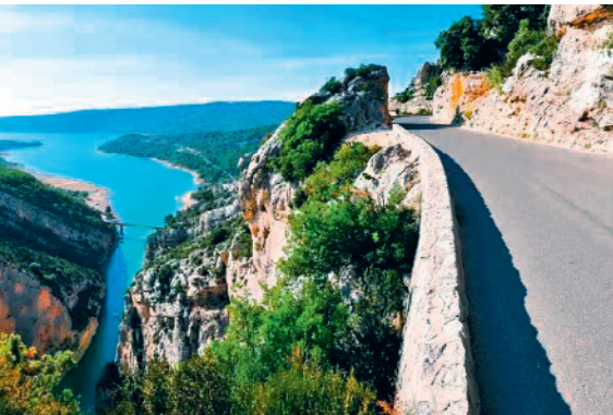
Eindruckliche Fahrt durch den Grand Canyon du Verdon.

res Highlight: Die Fahrt auf der Flanke der imposanten Schlucht des Grand Canyon du Verdon hinauf nach Palud-sur-Verdon. Die Wände des eindrucklichen Canyons sind bis zu 700 Meter hoch und mit Glück kann man Bartgeier beobachten. Im Hotel & Spa de Gorges de Verdon geniessen wir die atemberaubende Landschaft beim Lunch. Wer noch mehr Canyon mag, kann eine 30minütige Rundfahrt entlang der Krete des Canyons unternehmen.