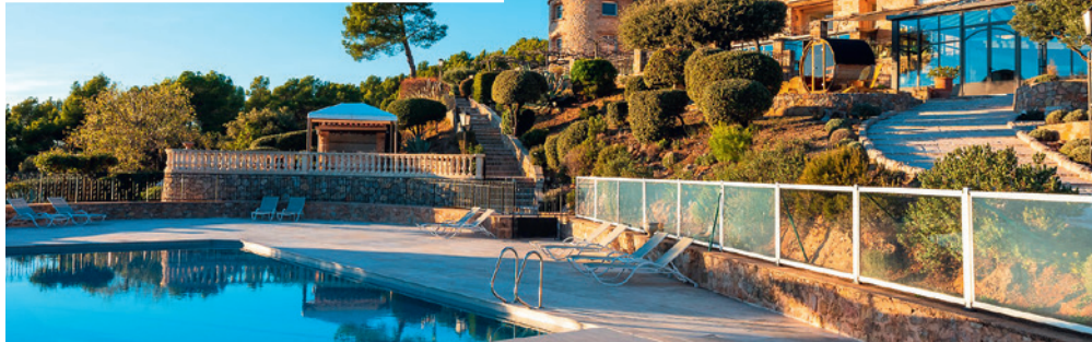
Die Bastide de Tourtour begeistert mit grandioser Aussicht. Die grosszügigen Zimmer verfügen über einen gedeckten Balkon.

Bereits bricht der fünfte Tag heran und es heisst Koffer packen. Die Rückfahrt erfolgt individuell. Der schnellste Weg zurück in die Schweiz führt über Genf. Bis zur Raststätte Grauholz bei Bern sind es 560 Kilometer, die Fahrzeit knapp sieben Stunden. Mögliche Zwischenstopps mit Übernachtung wären beispielsweise bei Grenoble, am Lac d’Annecy oder auf der Alp d’Huez.