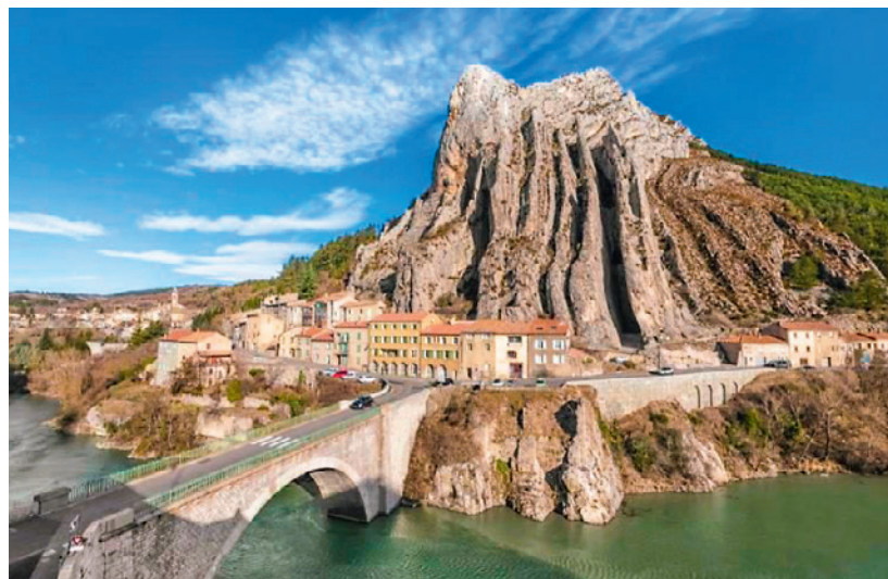
Sisteron ist bekannt als «Tor zur Provence».