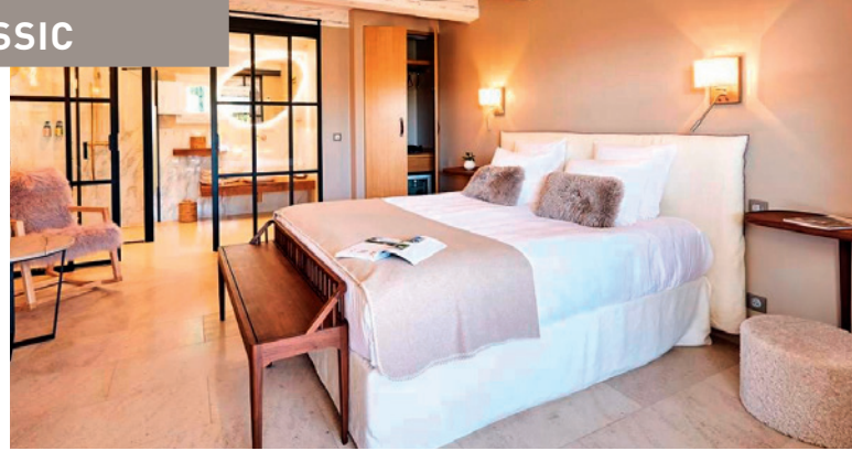
Die luxuriöse Bastide de Saint-Georges entzückt ...